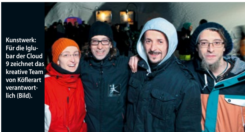
Kunstwerk: Für die Iglu-bar der Cloud 9 zeichnet das kreative Team von Köflerart verantwortlich (Bild).