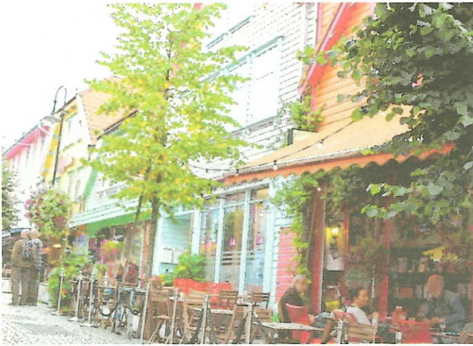
Bunt und fröhlich zeigen sich die Häuser in Stavanger, einem entzückenden Fleckchen Erde. (I.). Die Trolle sind überall in Norwegen zu sehen.